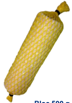
Bloc 500 g