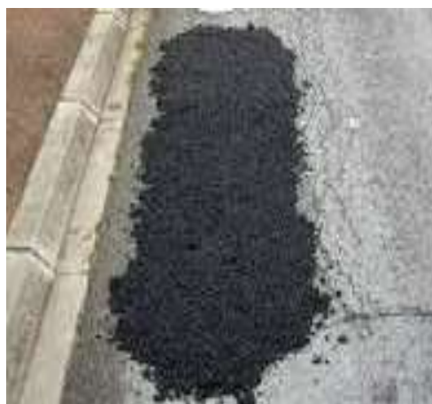
Remise en circulation immédiate

Consommation : 20 kg/m 2 /cm d'épaisseur