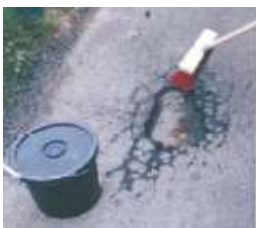
Nettoyer la surface à traiter