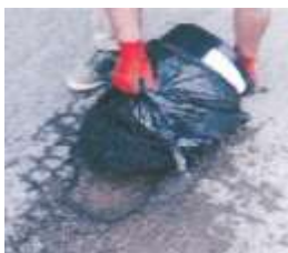
Appliquer l'enrobé par couches