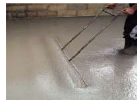
Figure 1 : Egalisation d'une chape après sa mise en place avec LC FLUID